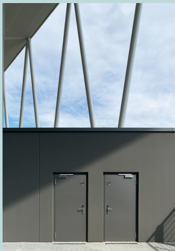
Einsatz für die EI 2 30-C5-S A „TECKENTRUP 62“: Auch bei den Brandschutz-türen im Außenbereich stand Barrierefreiheit von Beginn an mit auf der Agenda.