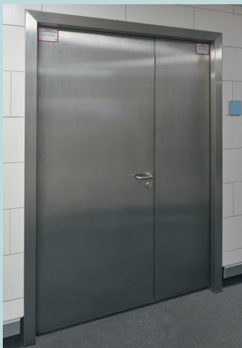
Erhöhte Hygiene-Anforderungen: Im Küchen- und Cateringbereich kommen Edelstahl-Türen zum Einsatz. Das schlichte Oberflächendesign erlaubt auch hier eine moderne ästhetische Raumgestaltung.

Personen mit Handicap den Stadionbesuch zu erleichtern, ist ein Anliegen des SC Freiburg und wurde daher bei der Planung des neuen Stadions von Anfang an mitgedacht. Barrierefreie Zugänge über Rampen, schwellenlose und automatisch öffnende Türen wurden ebenso wie geeignete Rollstuhlplätze von Beginn an eingeplant.