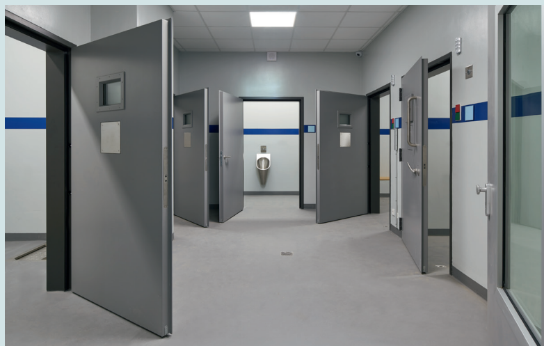
Wer seinen Stadionbesuch hinter einer dieser Türen verbringt, verpasst leider den Spielverlauf. Der flächenbündige Einbau beugt beidseitig Verletzungen vor. Verglaste Ausschnitte mit Sichtverschluss dienen bei Bedarf der Beobachtung des Insassen.