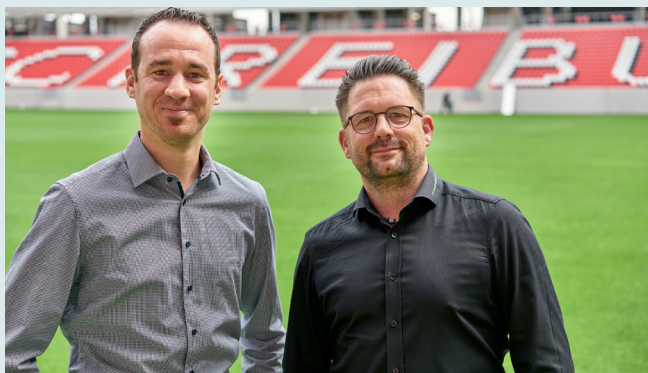
Regional verankert: Im Südwesten arbeiten Teckentrup und SchwarzwaldElemente seit Jahren erfolgreich im Bereich Bauelemente zusammen.