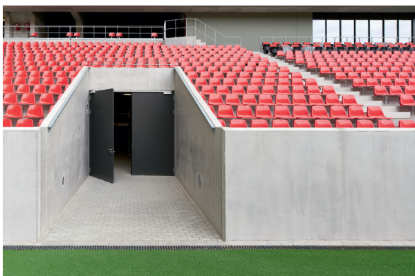
Türen mit den Ausmaßen eines Tores lassen auch Platz für große Geräte und dienen gleichzeitig als Fluchtweg.

Über 250 Türen in den verschiedensten Anforderungen lieferte Teckentrup für das Stadion-Projekt. Im Technik-Bereich waren bspw. große Türen als Durchlass für große Geräte und Fahrzeuge gefordert. Zudem sind die EI 2 30-Türen je nach Einsatzort mit Einbruchschutz (RC2/RC3) und Vollpanik-Funktion sowie der Vorrichtung für SALTO-Beschlag oder Magic Eye-Beschlag ausgestattet.