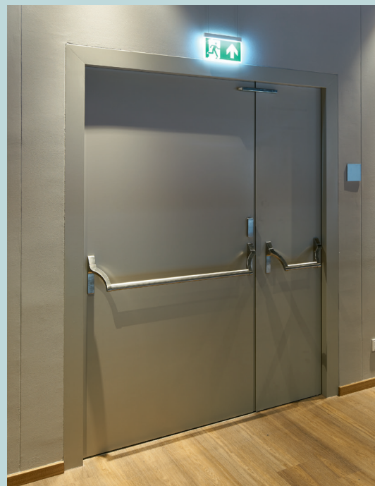
Türen in Fluchtwegen müssen immer zu öffnen sein, selbst wenn die Türen verschlossen sind. Panik-Stangengriffe bieten hier eine sichere Lösung, da sie bei körperlichem Druck auf das Türelement automatisch entriegeln.