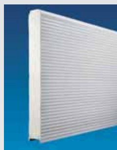
Zonder ribben, microgeprofileerd