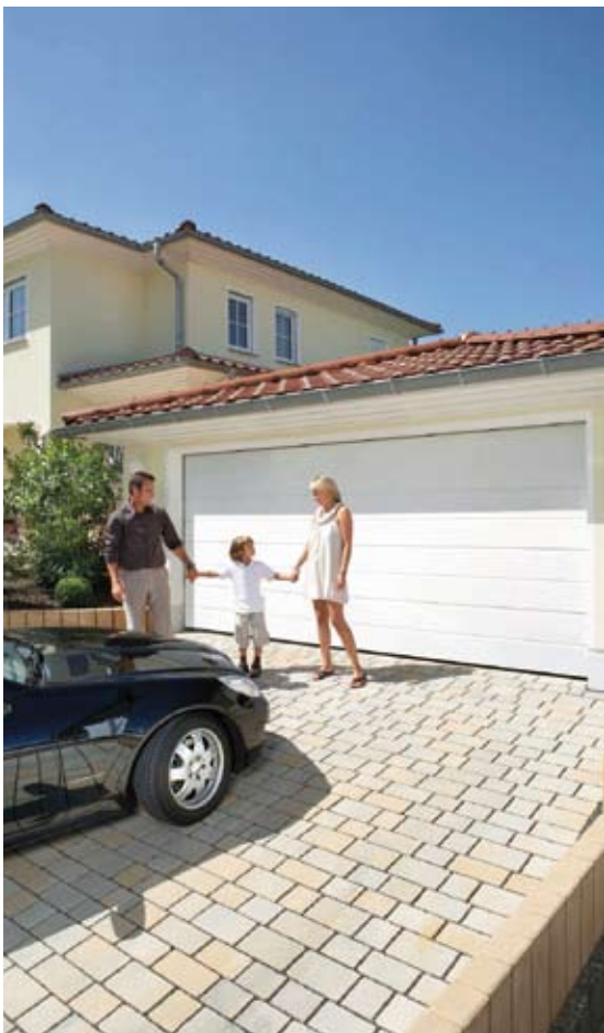
CarTeck garagedeuren GSW 40-M en L zijn leverbaar in tal van stijlvolle uitvoeringen, passend bij elke architectuurstijl. Dankzij de effectieve isolatiekern wordt warmteverlies voorkomen. Dat is vooral merkbaar als huis en garage één geheel vormen.

Om een uniform beeld voor garage en woning mogelijk te maken, levert Teckentrup nu ook bijpassende zijdeuren. Die zijn voor brede deuropeningen ook leverbaar met twee deurvleugels. Het alternatief voor garages zonder tweede ingang is een in de garagedeur geïntegreerde loopdeur.