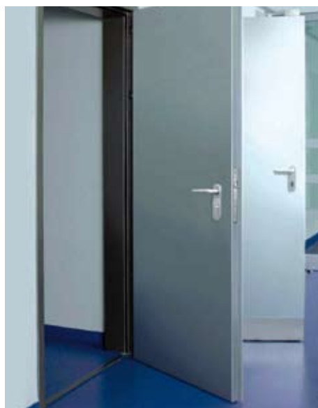
Teckentrup heeft een heel breed assortiment met zelfs een kogelwerende deur.