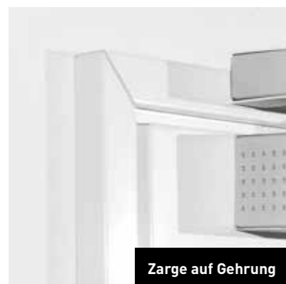
Zarge auf Gehrung