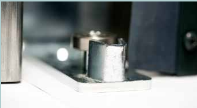
Darstellung/Ansicht untere Führung

Die neue untere Führungsschiene ermöglicht eine verdeckte Montage der Führungsrolle, so dass die Torblattführung nicht sichtbar ist. Da die Führungsrolle mit dem Gegeneinlauf verschraubt wird, ist die Position vorgegeben, wodurch mögliche Montagefehler vermieden werden. Darüber hinaus ist keine Verschraubung in den Boden erforderlich.