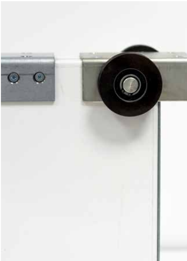
Torblatt in der Ausführung EI 2 30

Ganz gleich, welches Feuerschutz-Schiebetor Sie auch benötigen: Unser Programm bietet Lösungen für alle Fälle. Dabei profitieren Sie immer von erstklassigen Materialien, einer präzisen Verarbeitung, einer langen Lebensdauer – und jetzt natürlich auch von Sicherheitsstandards, die europaweit anerkannt sind.