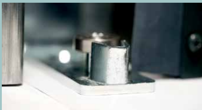
Darstellung/Ansicht untere Führung

Die neue untere Führungsschiene ermöglicht eine verdeckte Montage der Führungsrolle, so dass die Torblattführung nicht sichtbar ist. Da die Führungsrolle mit dem Gegeneinlauf verschraubt wird, ist die Position vorgegeben, wodurch mögliche Montagefehler vermieden werden. Darüber hinaus ist keine Verschraubung in den Boden erforderlich.