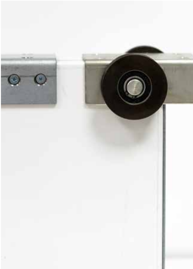
Torblatt in der Ausführung EI 2 30

Ganz gleich, welches Feuerschutz-Schiebetor Sie auch benötigen: Unser Programm bietet Lösungen für alle Fälle. Dabei profitieren Sie immer von erstklassigen Materialien, einer präzisen Verarbeitung, einer langen Lebensdauer – und jetzt natürlich auch von Sicherheitsstandards, die europaweit anerkannt sind.