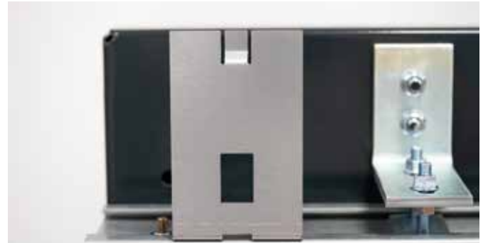
Aufhängung/Aufnahme für Torblende

die Torstechnik (u.a. Befestigungselemente und Schließsystem) komplett hinter den Blenden verschwinden lässt. Dank dieses neuen Systems sind die Tore nicht nur besonders montage- und wartungsfreundlich, sondern punkten auch mit einer ansprechenden Optik.