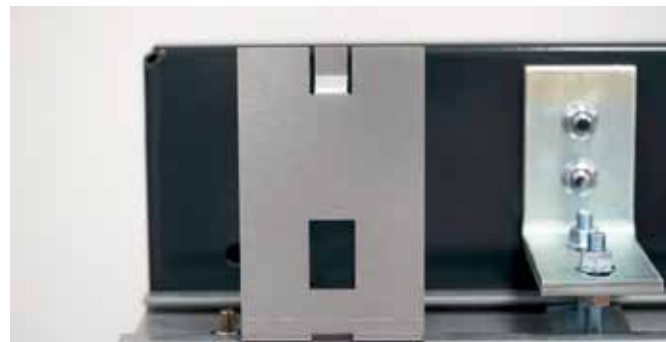
Aufhängung/Aufnahme für Torblende

die Tor Technik (u.a. Befestigungselemente und Schließsystem) komplett hinter den Blenden verschwinden lässt. Dank dieses neuen Systems sind die Tore nicht nur besonders montage- und wartungsfreundlich, sondern punkten auch mit einer ansprechenden Optik.